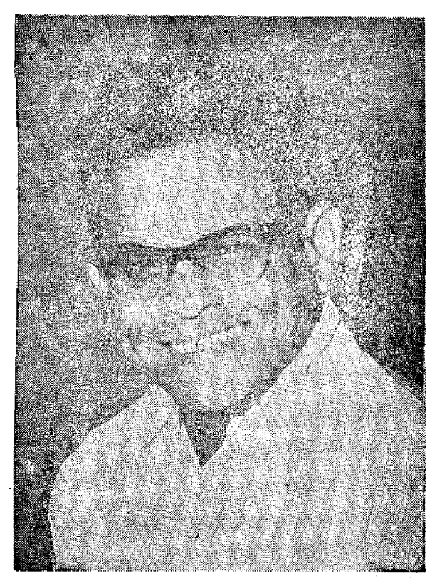
్ష్మ్యాత దర్శకుడు: ఆడు రైసుబ్బారావు

నేను కచ్చు తెరిచి చూపేటన్నటికి కారునీటు నా మీదుంది. అందేకారు తల్మకిందు అయిందన్న మాట. కారులో ఎవ్వరూలేరు. ఎవరో మూలుగు తున్నట్ల నిపించింది, "యా స్త్రే ముందుసీటుకూ డాష్