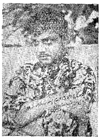
మ్యూజిక్ రిహాన్నల్స్ చుంది. అండుకని మిగణా

ఆరోజు (5.11.71) రా@ హిల్లాని 'జ్ఞా డె మండ్ ఎఫోనీయేషన్ "చాళ్ళ తరపున మా కచేరి జరిగింది. ఎక్కరోజు ఉపయం. హార్మోషిస్టు రాశాకు. వయొబినిన్ను (మాకర్కూ మర్యాజిక్ ఎక్సా మినేదన్ పుండి. కొంటర్ను పుడుకు ఉచ్చే వారి. పినహారుమందినీ టైన్లో చంసి మేను కలుగురం