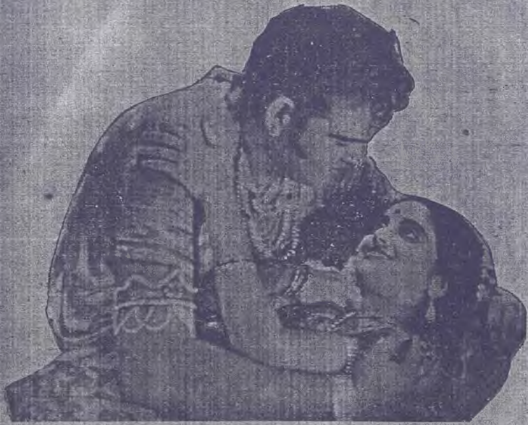
మహాదేవ ★ దేవదేవి