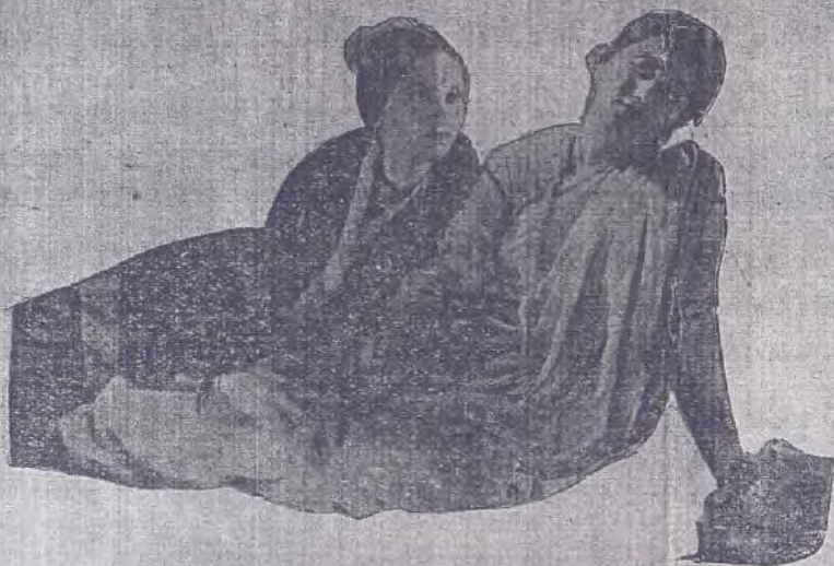
మధురవాణి ★ దేవదేవి