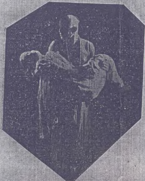
విశ్రాంతి ★ దేవదేవి