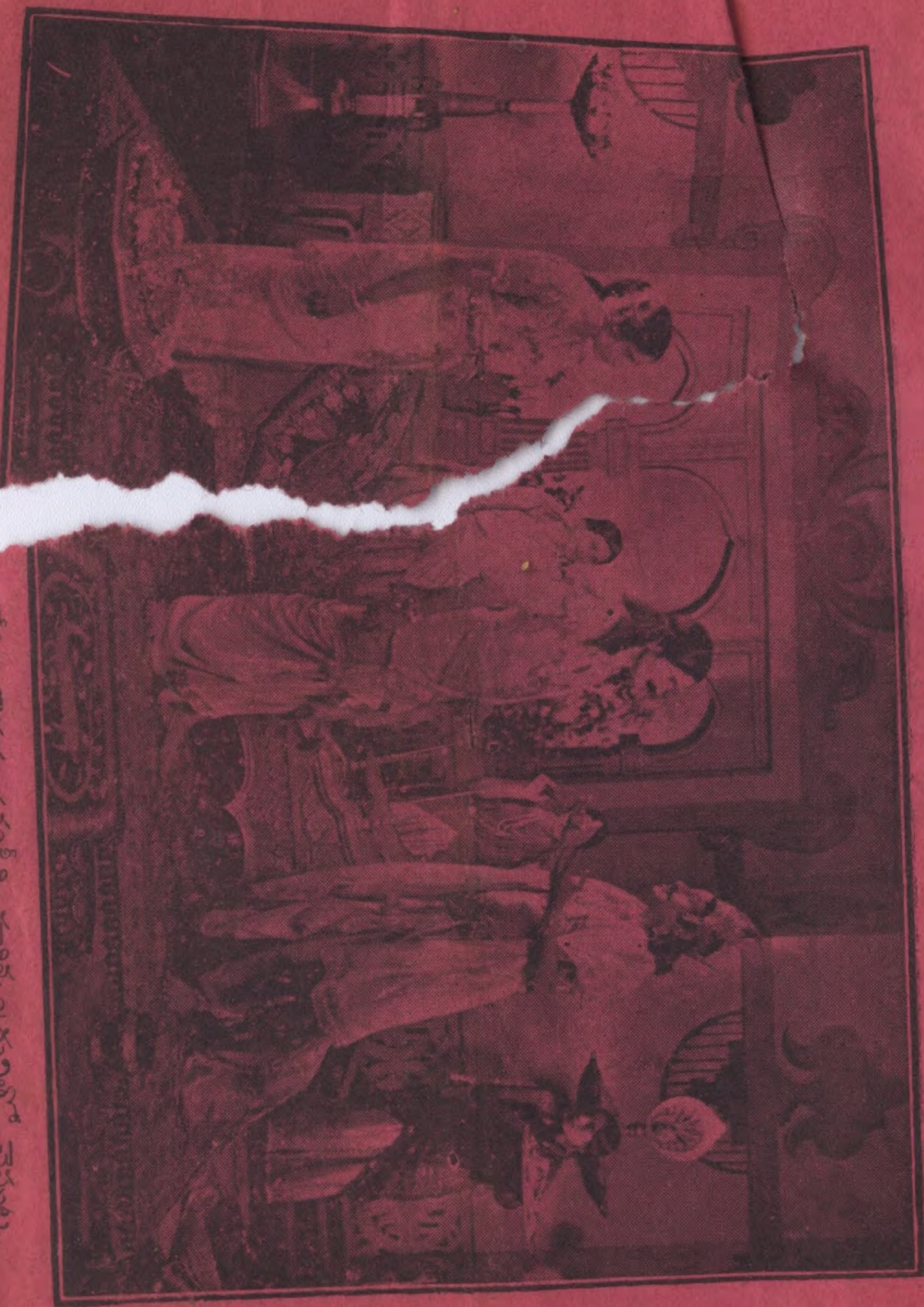
వంటకావులకు భయంకర మృగము

ఇతర పురాణకథలవలనే హరిశ్చంద్ర పురాణమున్ను “కలహ ప్రియాడగు” నారదునితోనే ప్రారంభించుచున్నది. ఇతడు ఇంద్రుని సభకువెళ్లి, “భూలోకములో అచ్చిన్నమైన యధార్థముతో నుండుటకు వీలున్నదా”యని యుక్తిగా ప్రశ్నించెను. సభలో ఈవిత్తనము ప్రశం కగా పెరిగి తుదకు విశ్వామిత్రవశిష్టులకు చర్చలోదిగి వారికి పూర్వ ద్యేమాను వాననవలన ఒకరిని యొకరు తిట్టుకొనడములో ప్రవేశించిరి అటుపైన అఘోర ప్రతిజ్ఞచేసుకొని, వశిష్టుతో సభలోపలికి హరిశ్చంద్ర మహారాజు దృఢచిత్త యధార్థపరుడు కాడని రూపించుటకై, విశ్వా మిత్రుడు భూలోకమునకు వెంటనేవచ్చి వేసెను.